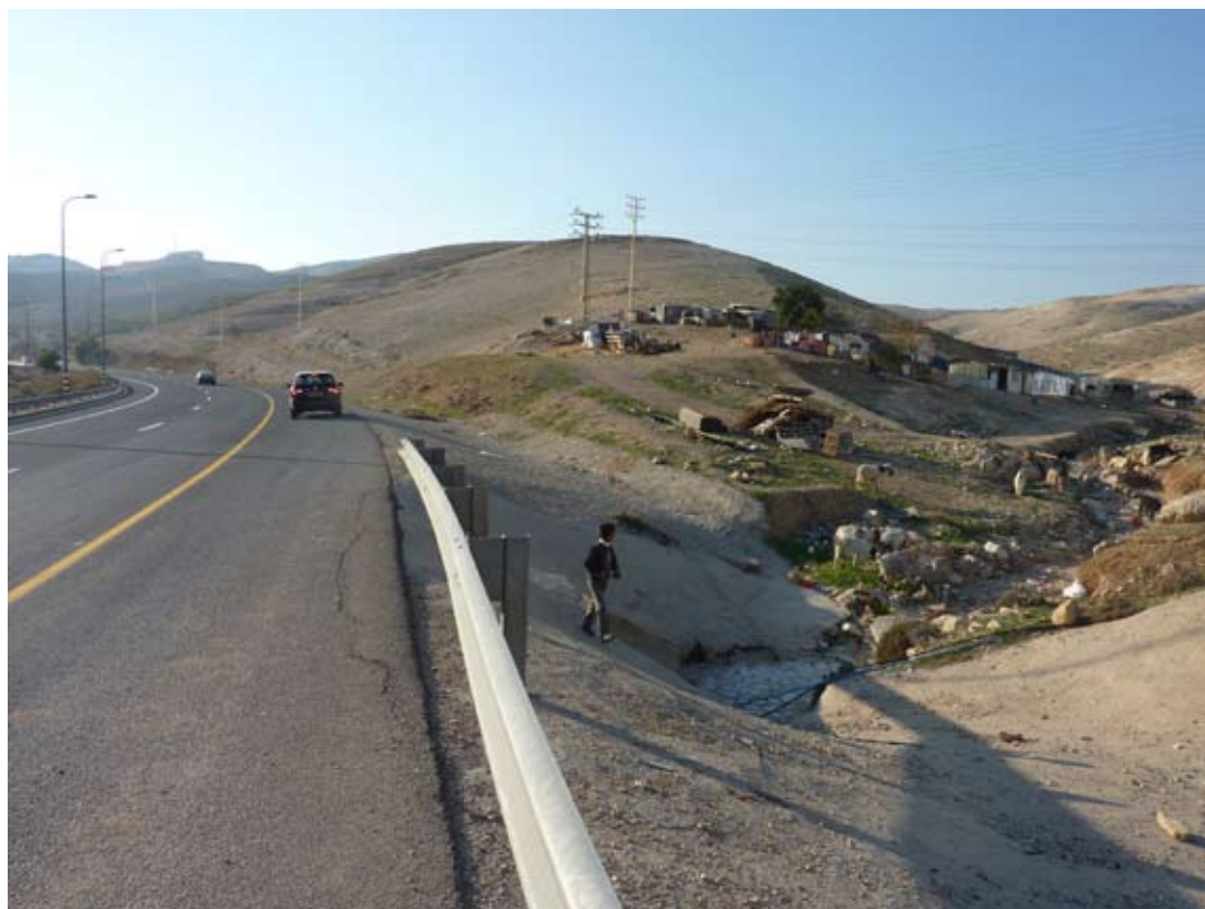
Campements sauvages de Bédouins près de la route 1

En conclusion, le gouvernement israélien devrait adopter une ligne politique claire et cohérente et accélérer la réalisation du plan E-1, en dépit des difficultés administratives et juridiques et malgré les protestations palestiniennes et les critiques des chancelleries. Ce projet de construction est d'un intérêt vital pour l'Etat juif ; un retard d'application mettrait en péril sa réalisation effective en raison de la construction palestinienne illégale et de la présence massive des campements bédouins. Plus grave encore, avec un tel retard, le risque serait de séparer la ville de Maalé Adoumim et de l'isoler à jamais de Jérusalem.