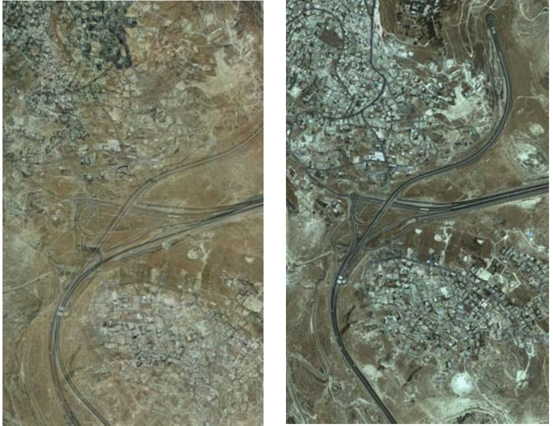
Constructions palestiniennes empiétant sur la route Jérusalem-Maalé Adoumim (en 1989 et en 2012)

Depuis que ce plan a été approuvé voila déjà 13 ans, la superficie de cette zone a été réduite par la présence de tribus bédouines et une construction palestinienne illégale. De fait, le corridor s'est rétréci à une largeur d'un seul kilomètre.