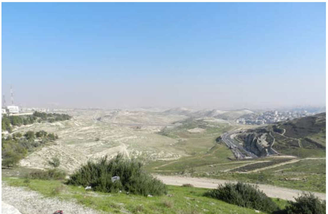
Vue de la zone E1 et de Maalé Adoumim (à droite) depuis Har Hatsofim à Jérusalem

Une grande partie des terres de la zone E-1 ne convient pas à la construction en raison de considérations topographiques et du fait qu'une partie est destinée à devenir une réserve naturelle. Sur son côté Ouest, il est prévu de construire un quartier résidentiel de 3 500 unités de logement, accompagnées de lieux touristiques, d'hôtels, et d'entreprises industrielles et commerciales qui pourront servir toute la population de la région de Jérusalem et fournir des milliers d'emplois aux Israéliens et aux Palestiniens.