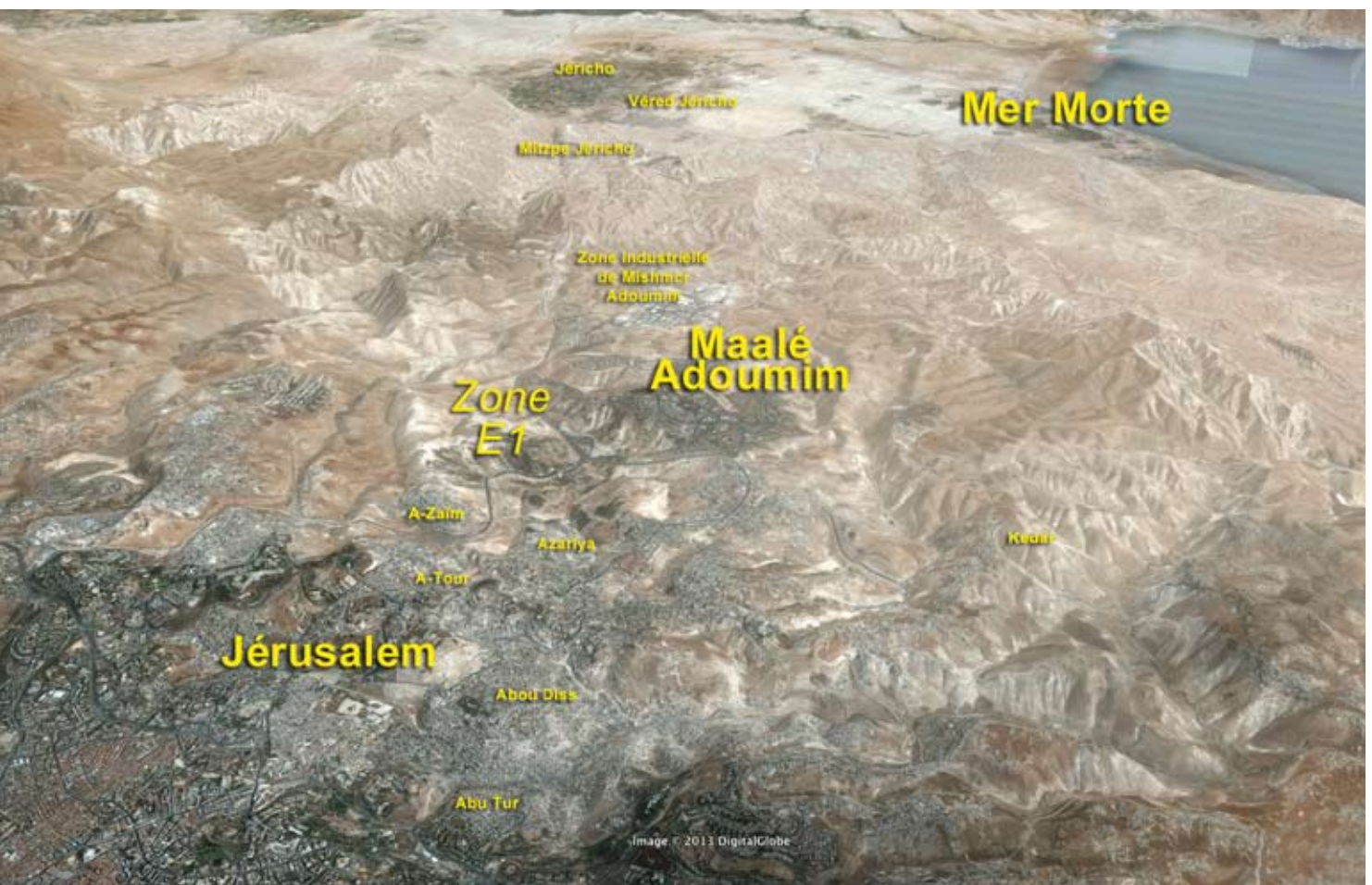
Carte Google Earth. Vue de Jérusalem jusqu'à la mer Morte

Depuis la création de l'Etat juif, ses dirigeants ont poursuivi cet objectif afin de renforcer les frontières du pays et de préserver une présence civile permanente. Au fil des années, la Galilée et le Néguev, comme les grands blocs d'implantation en Cisjordanie après 1967 et la périphérie autour de Jérusalem, ont été construits à partir de ce concept.